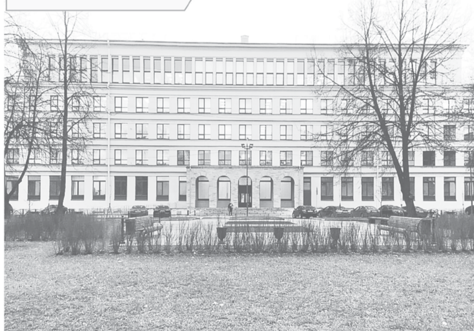
Прокуратура Ленинградской области (Санкт-Петербург, Торжковская ул., 4)

ЗА 11 МЕСЯЦЕВ 2021 ГОДА ПОСТУПИЛО В ПРОКУРАТУРУ ЛЕНИНГРАДСКОЙ ОБЛАСТИ.