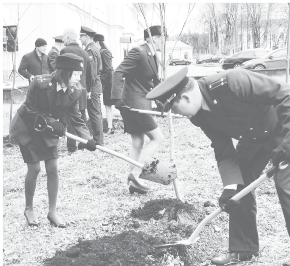
Этой осенью возле Гатчинского Дома культуры к 300-летию создания российской прокуратуры была высажена Аллея героев — 30 лип и кленов

регион обеспечил благоустроенным жильем более 1500 детей, направив на это порядка 3,5 млрд рублей.