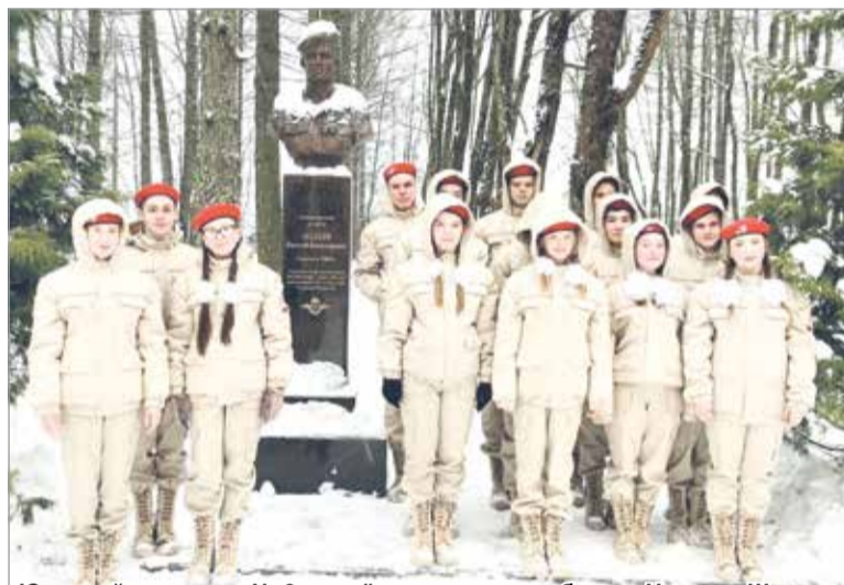
Юнармейцы школы № 2 в почётном карауле у бюста Николая Шалаева