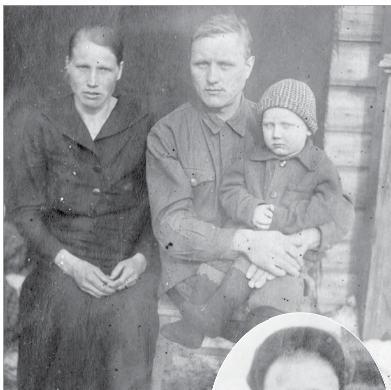
• С мамой и папой, вернувшимся с финской войны (1940 год)