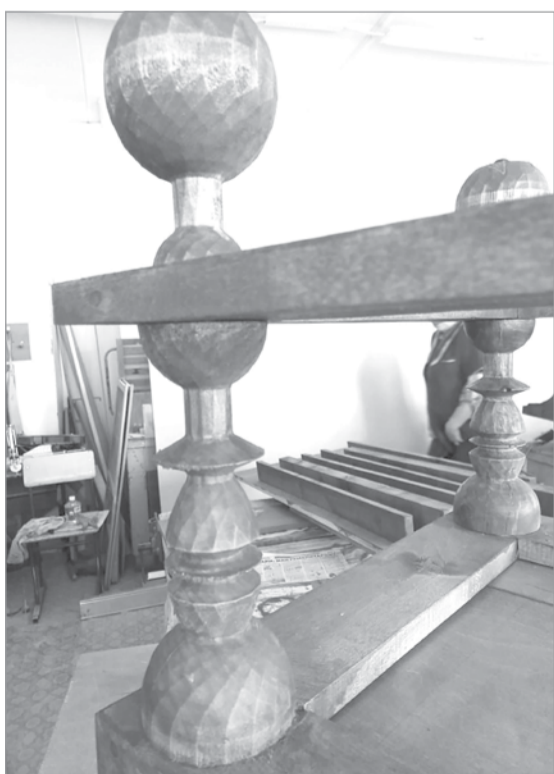
Детали будущего макета